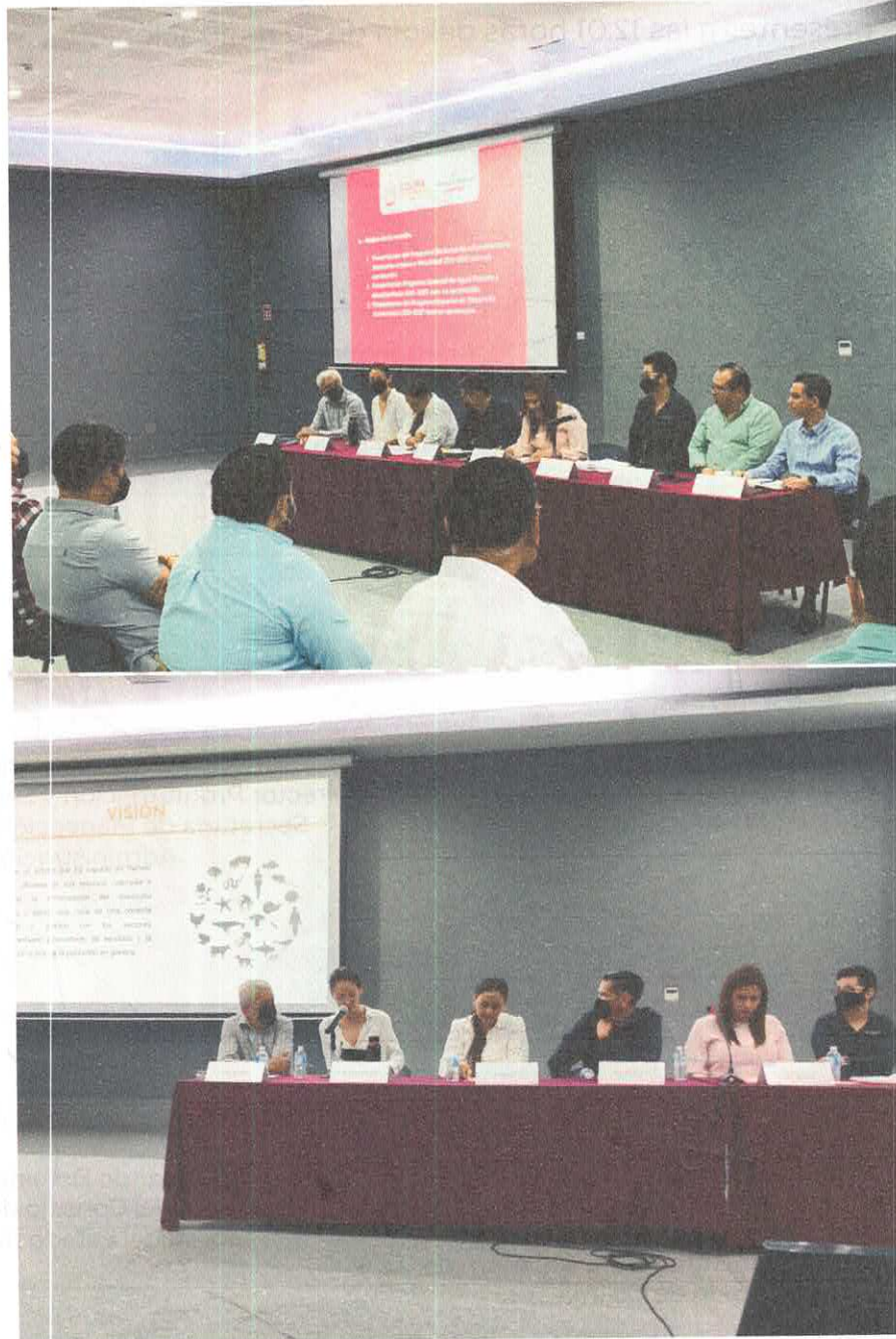
"2022, año de la esperanza"